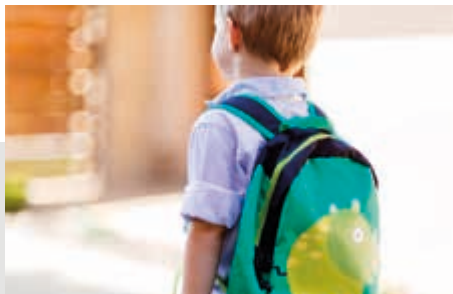
ГРОМАДСЬКІ МІСЦЯ Й ОСВІТНІ ЗАКЛАДИ