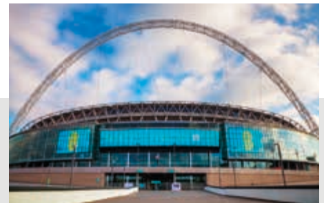
СПОРТИВНІ МАЙДАНЧИКИ І ЗОНИ ВІДПОЧИНКУ

Оберегайте здоров'я людей від потенційних носіїв коронавірусу та інших інфекційних захворювань – система VIRALERT 3 перевіряє температуру відвідувачів на вході і виявляє тих, у кого вона підвищена.