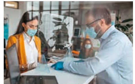
ОФІСИ ТА ВИРОБНИЧІ МАЙДАНЧИКИ